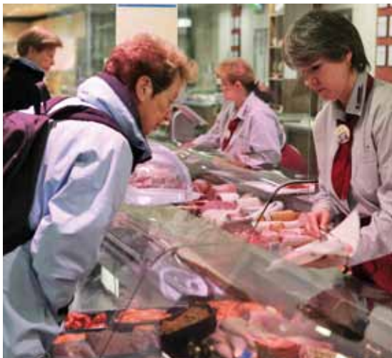
Kompetente Beratung über Produkte und deren Qualitätssicherung trägt maßgeblich zum Vertrauen der Kunden und damit zum Erfolg des Lebensmittelhandels bei.

QS kennt den Lebenslauf der Lebensmittel und jedes Unternehmen, das an der Herstellung und Vermarktung der Produkte beteiligt ist. QS kontrolliert jedes dieser Unternehmen regelmäßig auf die Einhaltung der