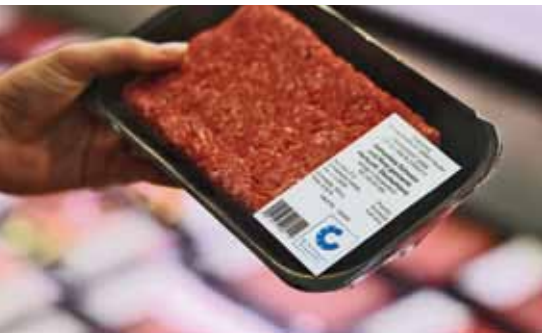
Das Mindesthaltbarkeits- und Verbrauchsdatum der Ware sollte ständig kontrolliert werden.

QS hat zu diesem wichtigen Themenbereich ein aussagekräftiges Plakat (siehe rechts) für die Mitarbeiter-Pausenräume entworfen, das Sie unter der E-Mail-Adresse info@q-s.de kostenlos anfordern können.