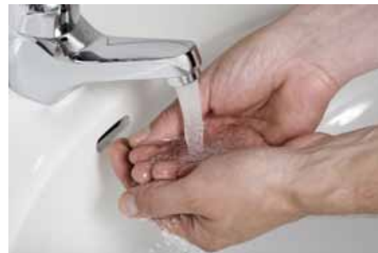
Im Lebensmittelhandel hat, wie in allen anderen Bereichen, das Händewaschen höchste Priorität.