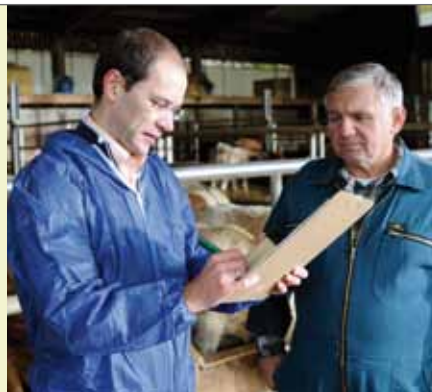
Jeder Betrieb muss die Produktion von Lebensmitteln genau dokumentieren.

Ergänzend zu den regulären Prüfungen werden jährlich mehrere Hundert unangemeldete Zusatzkontrollen durchgeführt. Dadurch wird sichergestellt, dass die QS-Anforderungen auch zwischen den regulären Systemkontrollen eingehalten werden.