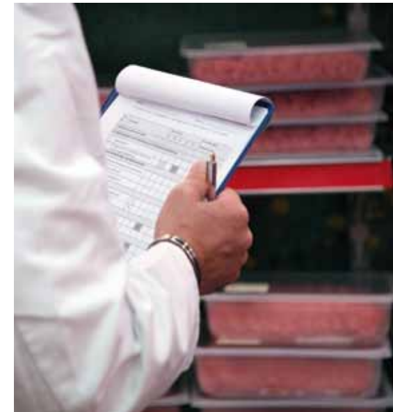
Durch intensive Kontrollen wird in Deutschland die Qualität von Fleisch, Wurst und Schinken sichergestellt.

Erfahren Sie in diesem Markenlehrbrief mehr über den Beitrag, den die durchgängige Qualitätssicherung für die Sicherheit der