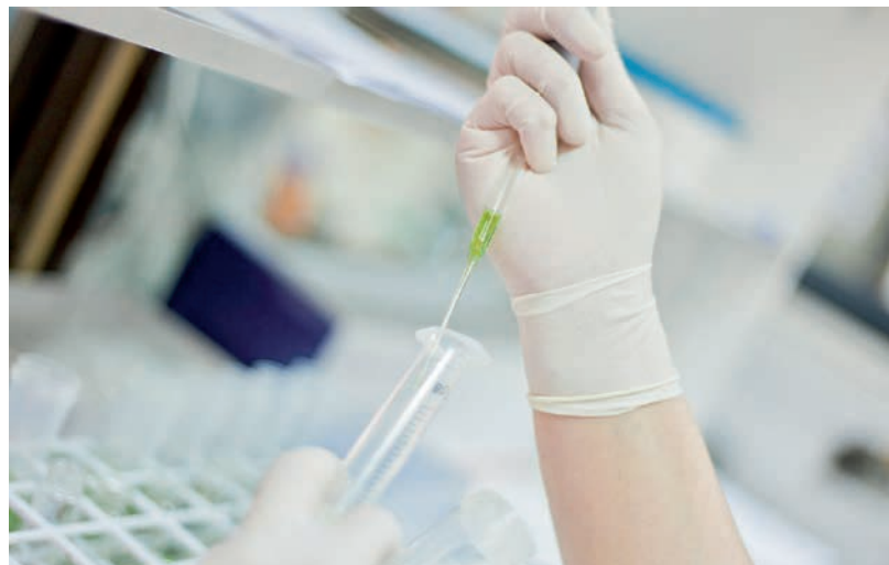
Das Labor von La Unión Corp. hat seit über einem Jahr eine QS-Anerkennung