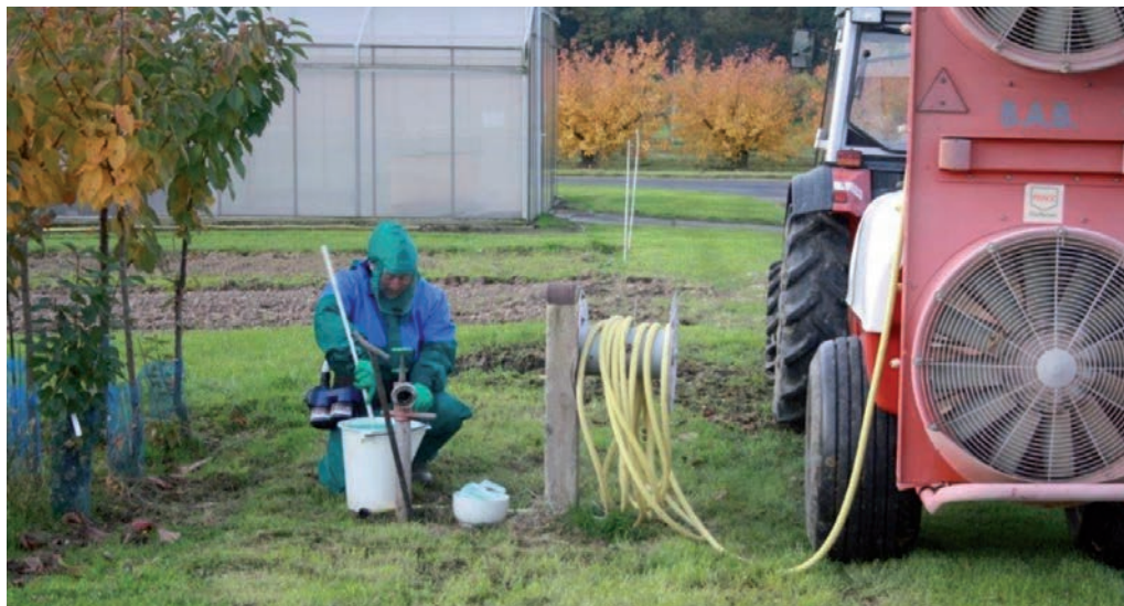
Entsprechende Schutzkleidung ist wichtig, damit keine gesundheitsschädlichen Bestandteile von Pflanzenschutzmitteln aufgenommen werden

Um die eigene Gesundheit bzw. die der Mitarbeiter bei und nach der Anwendung von Pflanzenschutzmitteln wirksam zu schützen, ist eine geeignete Schutzausrüstung das A und O. In den QS-Leitfäden für die Erzeugung von Obst, Gemüse und Kartoffeln sind die sichere Anwendung von Pflanzenschutzmitteln, der Einsatz einer geeigneten Schutzausrüstung und die Einhaltung der Wiederbetretungsregeln gemäß den gesetzlichen Vorgaben und Herstellerangaben zentrale Bestandteile der Anwendungssicherheit im Pflanzenschutz.