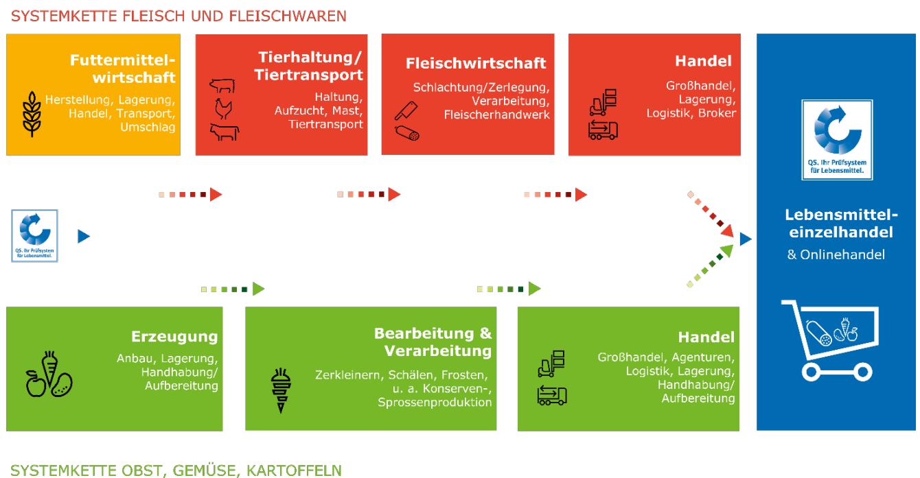
Abbildung 1: Systemketten im QS-System